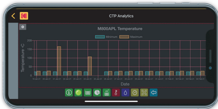
环境条件（温度、湿度或空压情况）